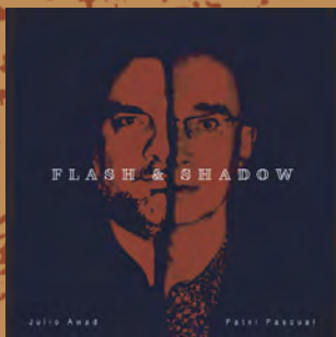
Flash & Shadow, 2022