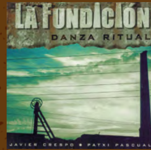
La fundición Danza ritual, 2022