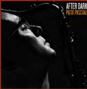
After Dark, 2011