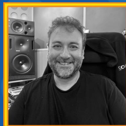
Fran Gude Diseño de sonido